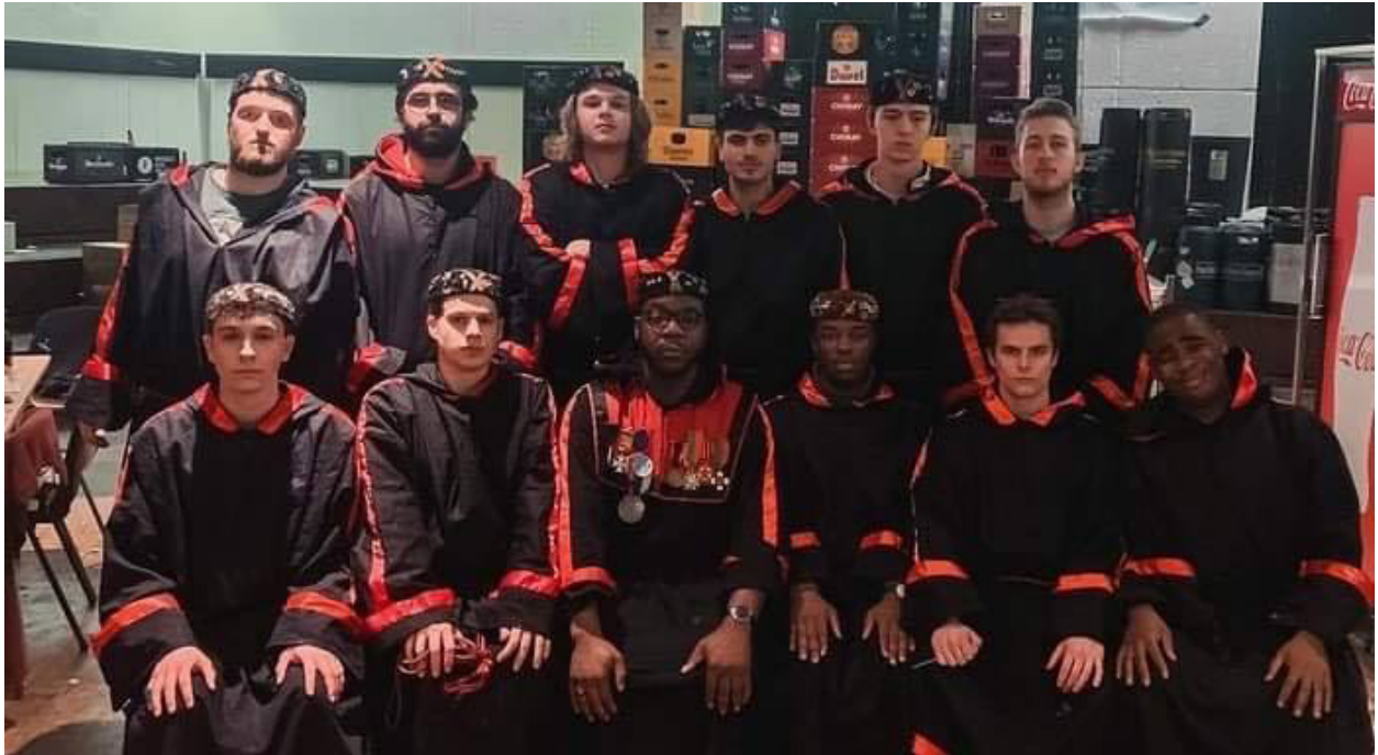
L'Ordre des Moines