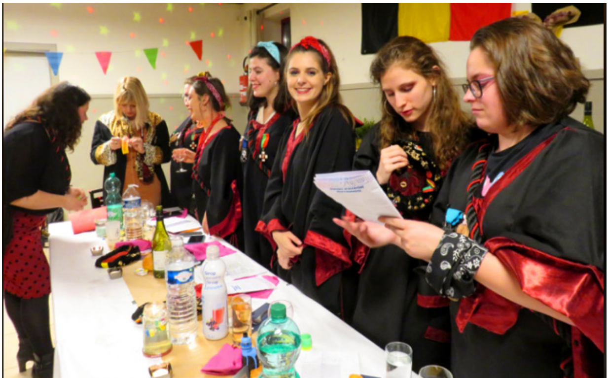
L'Ordre des Petites Culottes